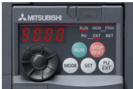
Unitate de parametrizare cu cursor digital rotativ inclusă

Pe lângă introducerea și afișarea valorilor parametrilor, afișajul integrat cu LED-uri este folosit și pentru a monitoriza și verifica valorile de funcționare și codurile de alarmă.