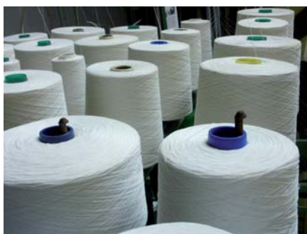
Acționările cu convertizor de frecvență Mitsubishi intră acum în echipamentul standard din industria textilă.