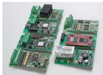
Carduri de opțiuni pentru funcții suplimentare

Convertizoarele FR-E700 pot fi conectate fără accesorii suplimentare la rețele Modbus RTU iar, prin module opționale, și la alte sisteme de rețea cum ar fi Profibus/DP, CC-Link, DeviceNet și LonWorks.