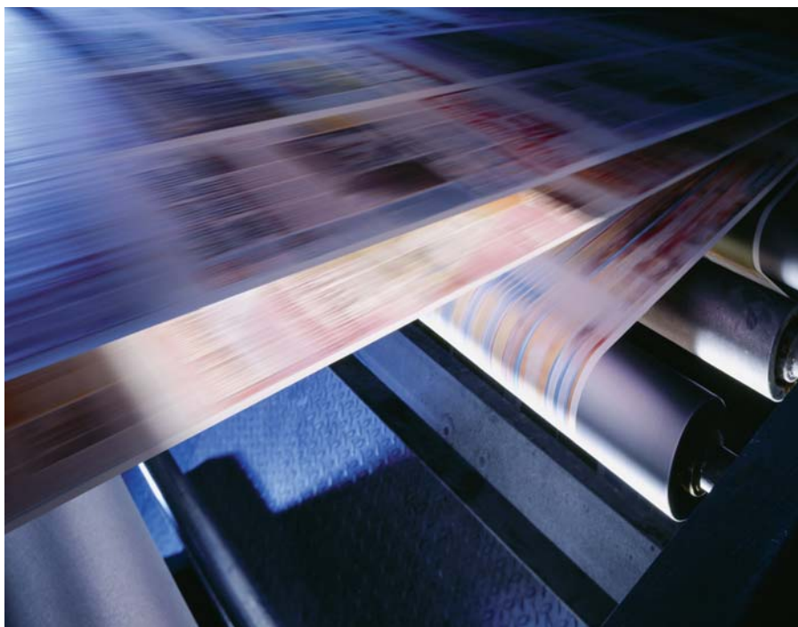
Sistemele folosite pentru transportul materialelor, cum este acest exemplu dintr-o tipografie, constituie doar una din aplicațiile noii serii FR-E700.