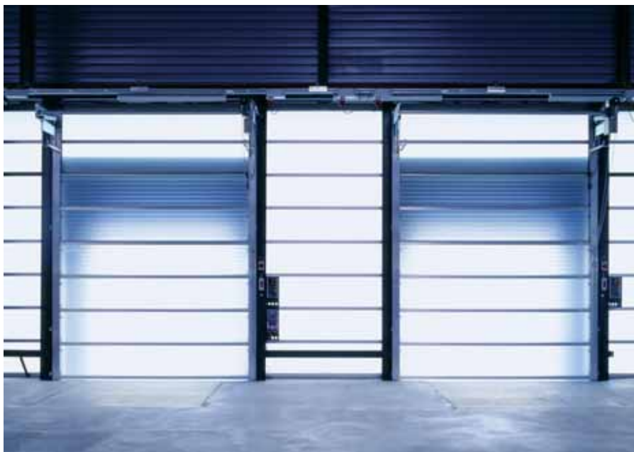
Acționările pentru uși și porți sunt doar câteva din multiplele aplicații ale noii serii FR-D700.