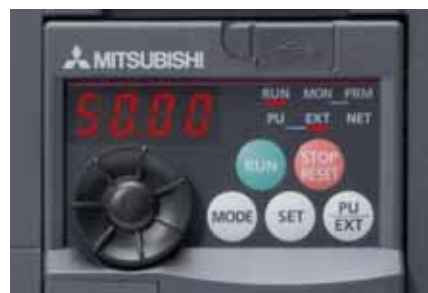
Unitate de parametrizare incorporată, pentru mai mulți utilizatori, cu „Digital Dial” (cursor digital rotativ).

Pe lângă introducerea și afișarea diferiților parametri, afișajul de patru cifre cu LED-uri monitorizează și afișează valorile curente de operare și mesaje de alarmă.