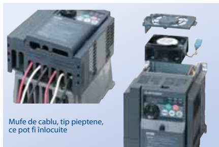
Mufe de cablu, tip pieptene, ce pot fi înlocuite

Ventilatoarele sunt proiectate ca unități compacte ce pot fi înlocuite în mai puțin de 10 secunde pentru curățare sau în caz de defecțiune.