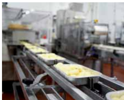
Benzile transportoare și conveioarele cu lanț sunt aplicațiile ideale pentru FR-D700.